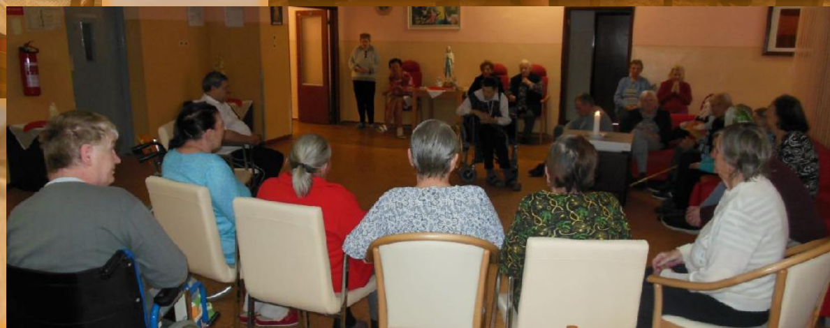
Pravidelné spoločné modlitebné stretnutia v miestnej kaplnke a na oddeleniach.